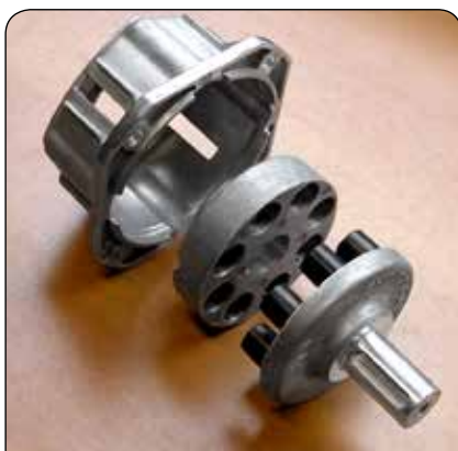
Junta elástica integrada para el mejor acoplamiento de la bomba